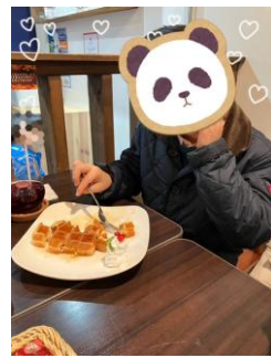
ブラレールカフェ小鉄